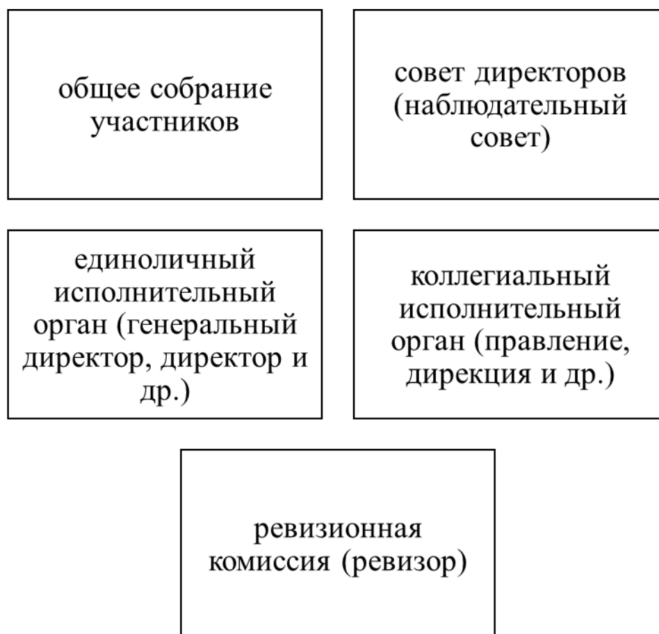
Рис. 1 – Органы управления обществом с ограниченной ответственностью

На основании проведенного анализа возможно выделить пять органов управления в ООО. Представим их на рисунке 1.